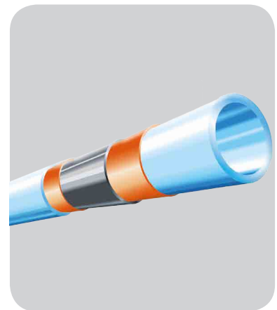
GAROS multiFlex Formstabil