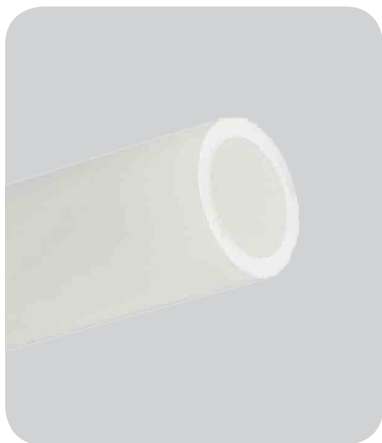
GAROS ecoFlex Spannungsbeständig

eco, pex und multiFlex sind korrosionsfrei und inkrustationsfrei. Das sichert eine sehr lange Lebensdauer.